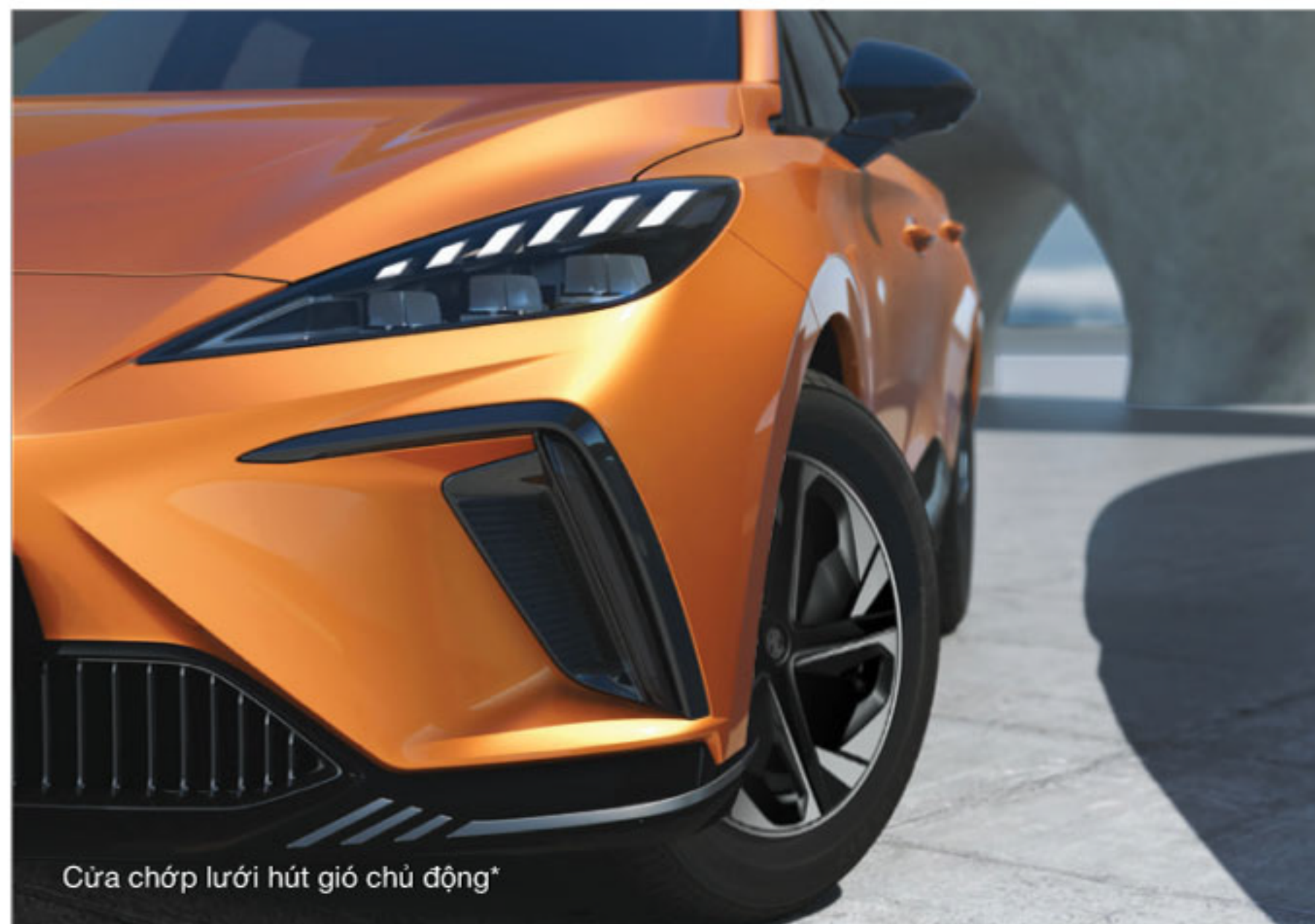
Cửa chớp lưới hút gió chủ động*