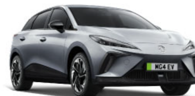
MÀU BẠC SILVER