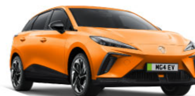
MÀU CAM FIZZY ORANGE

Dòng xe MG4 EV có sẵn sáu màu sắc tuyệt đẹp để bạn lựa chọn. Hãy tạo nên sự khác biệt cho chiếc MG4 của bạn.