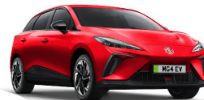
MÀU ĐỎ FLARE RED