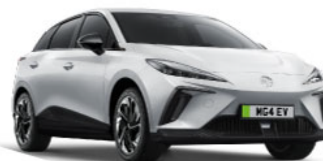
MÀU TRẮNG YORK WHITE