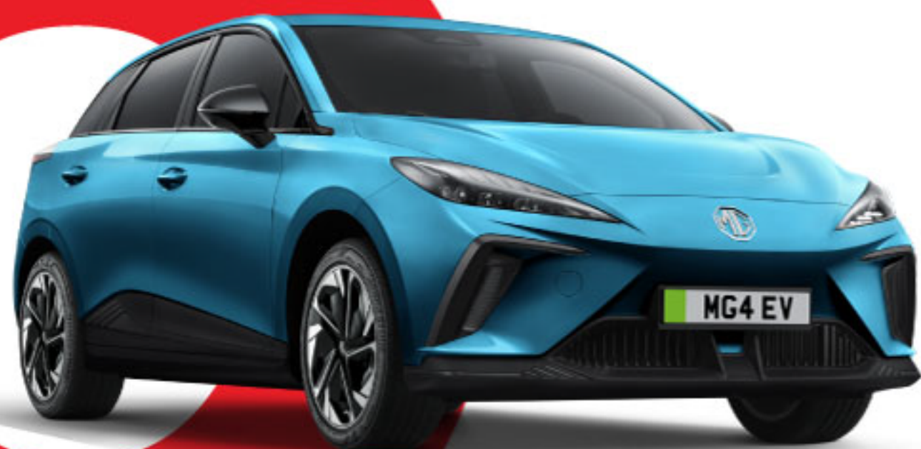
MÀU XANH DƯƠNG BRIGHTON BLUE