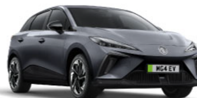
MÀU XÁM ANDES GREY